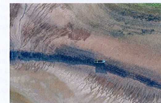
Le réservoir de Vioreau a été vidé à partir de décembre 2022 pour permettre les travaux de modernisation du barrage.

Montant des travaux : 16,5 millions d'euros