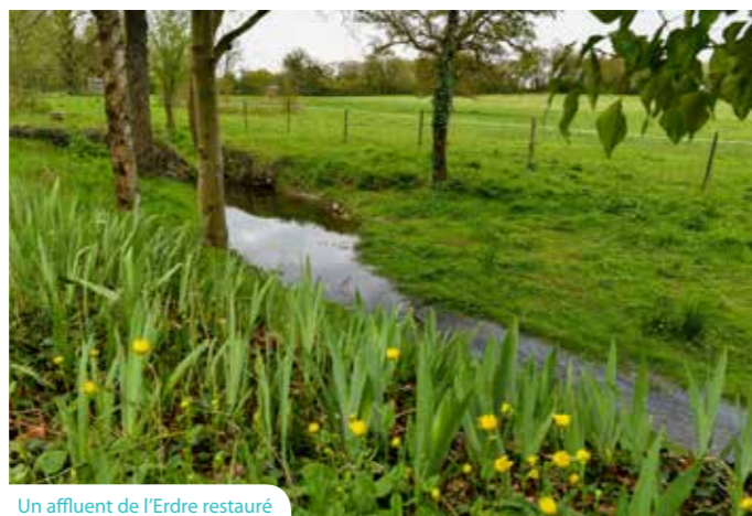
Un affluent de l'Erdre restauré

Marqueur identitaire, atout pour les communes, la qualité de son eau et sa biodiversité est pourtant fragilisée depuis des décennies : il est désormais urgent d'agir en faveur de la reconquête de son équilibre naturel .