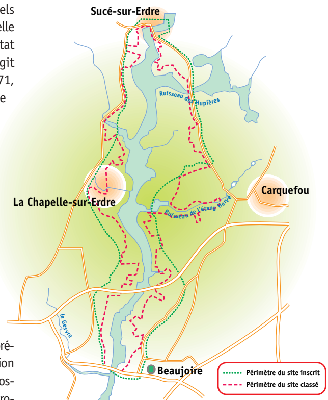
Périmètre du site de la vallée de l'Erdre